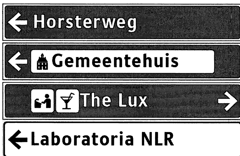
Voorbeelden uitvoering strokenborden

Toeristisch-recreatieve objecten en voorzieningen worden vermeld op strokenborden met witte opschriften op een bruin veld. Aan de naam van een object kan een pictogram worden toegevoegd ter verduidelijking van de activiteit. Het wordt geplaatst vóór de naam van het object. De afstand tot de objecten / voorzieningen wordt niet op de strokenborden vermeld.